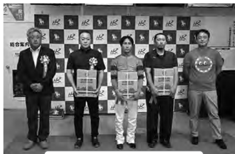
太陽の瞳特別 表彰式

ホッカイドウ競馬は馬産地日高にとって大変重要な産業となっております。今後とも応援よろしくお願ひします。