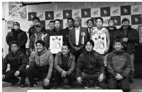
万馬券特別 表彰式