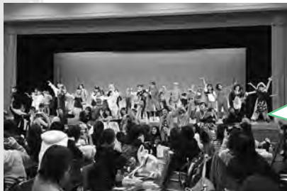
「Tダンス スクールによる ヒップホップ ダンス