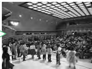
14回の開催の中で 一番の参加人数との ことです。 また来年もご来場 お待ちしております

会場の静内古川町の公民館には町内外から約1000人が参加し、会場に集まった子供達は好きなアニメキャラクターや動物などに仮装し、ハロウィン気分を味わっていました。