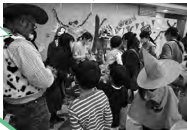
バルーン アートも 大盛況