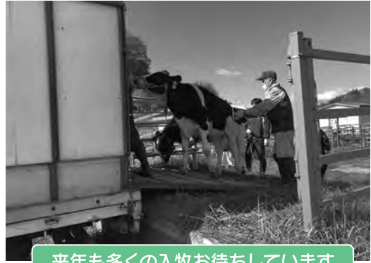
来年も多くの入牧お待ちしております。

今年度の退牧時の目標として1頭当たり150kg以上の体重増としており、結果はほぼ目標通り1頭当たり144kgの体重増となりました。ホルスタイン種の月平均の体重増は20～25kg程度であり、5か月半で144kgは非常に満足のいく結果となりました。なお、体調不良での途中退牧はなく、受胎率も70%程度とホルスタイン種の平均的な受胎率45%を大きく上回る結果となっております。この受胎率を維持できたということは、共済組合獣医師の指導の下、牛1頭ごとの管理台帳を作成し体調不良牛の早期発見、早期治療の個体管理と、それに対応する牧野管理人のきめ細やかな管理のなせる業であることは言うまでもありません。