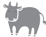
ホクレン南北海道市場JAしずない平均価格