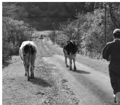
来年も多くの入牧お待ちしております。

そして、受胎率については71%とホルスタイン種の平均受胎率60%を大きく上回っており、昨年同様の好結果となりました。この点については、2~3週間に1回の衛生検査実施による健康状態の把握やダニ除けの薬の塗布、空腹のストレスもなかったことが大きく寄与していると考えられます。