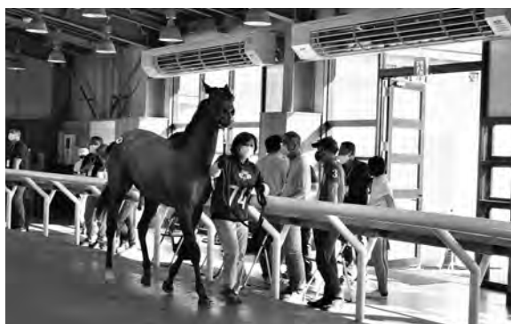
セリ前で興奮気味の様子です