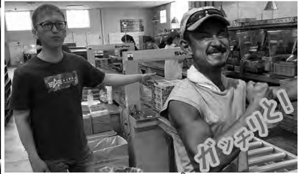
ミニトマト紹介動画