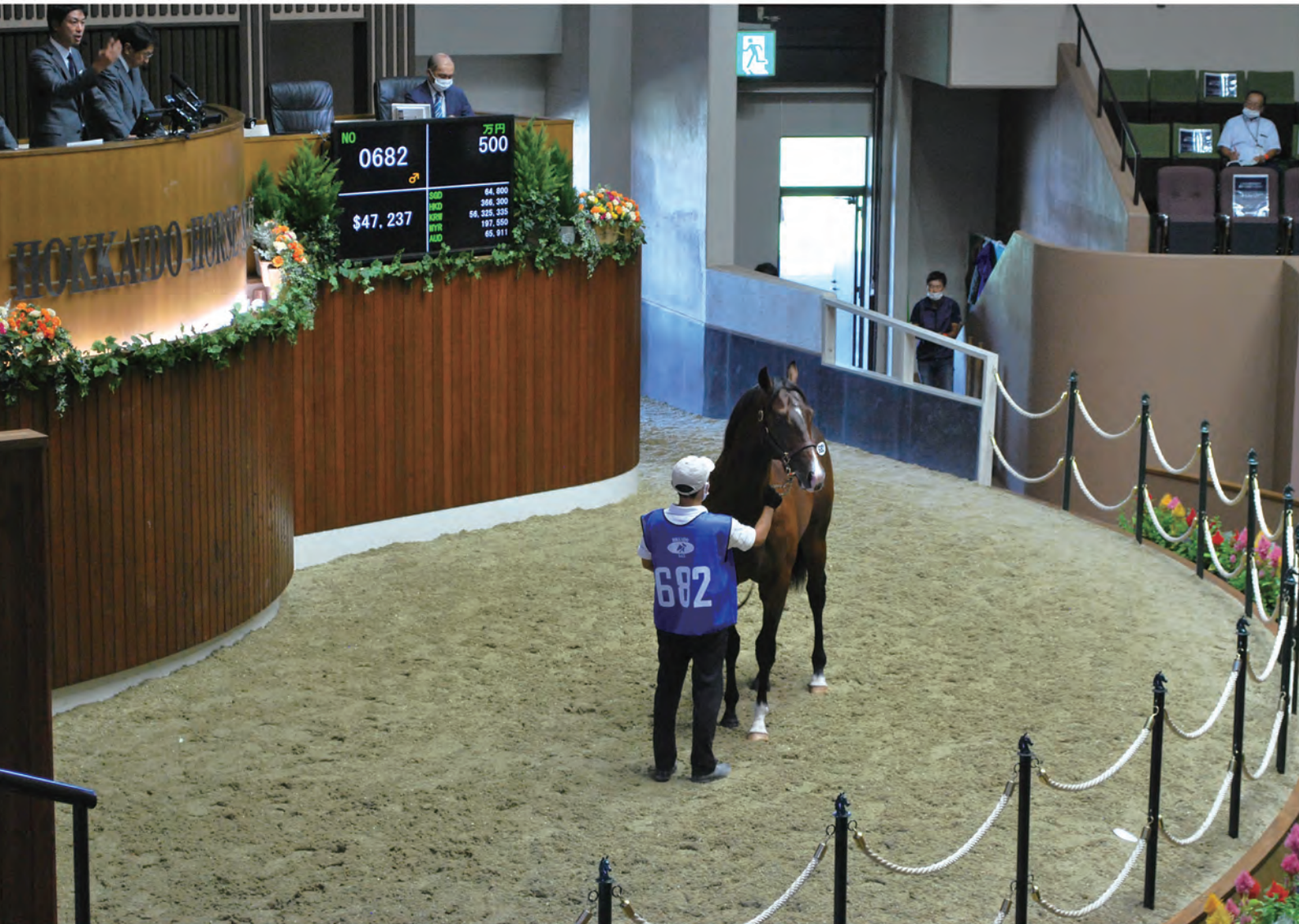
北海道市場サマーセール上場の風景