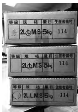
上から秀品、優品、○品です。