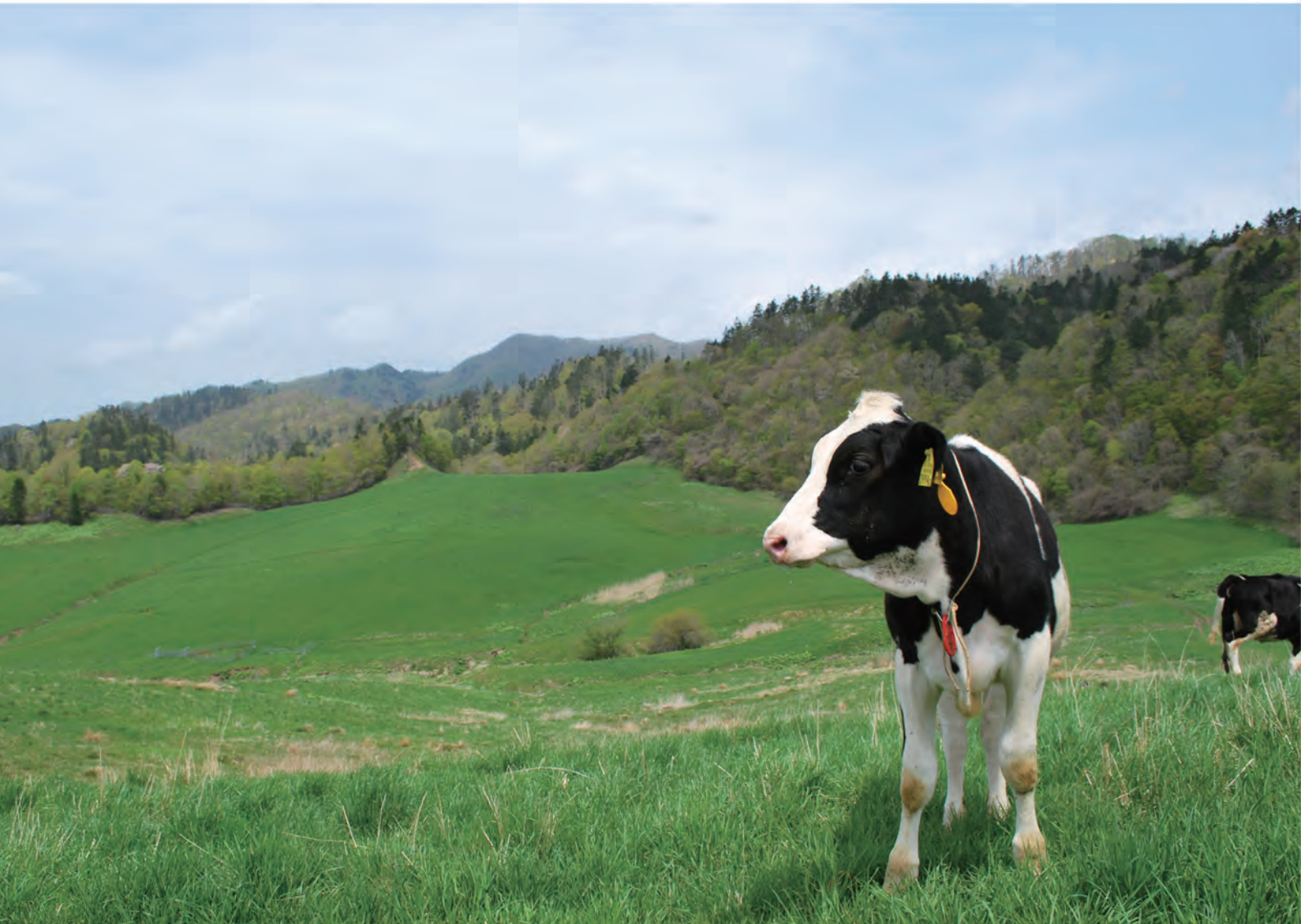
新ひだか町静内地区川合牧野団地に入牧した牛たち