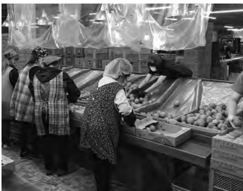
大玉トマトは全て手作業での選果となります。