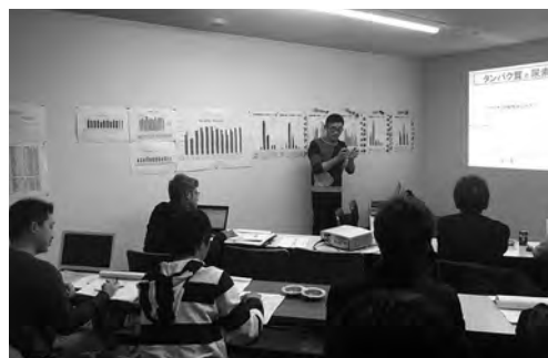
後継者である青年部も勉強熱心です。