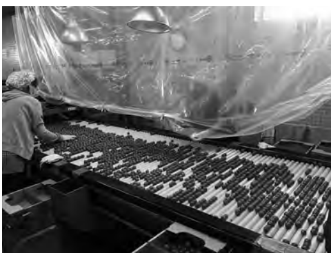
今年は新型コロナウイルス感染症拡大防止のための対策を行っております。

ミニトマトの選果については、選果機が大小1台ずつで計2台あり、大型選果機については2L〜Sのサイズごと8ライン選別でき、小型選果機については2L〜Sのサイズごと6ライン選別できます。ベテランのパートタイム労働者の方も多く、小型選果機においてサイズごとに流れてきたミニトマトを箱に入れ、重量を測り、調整するという作業がありますが、箱に入れる段階で既に基準の重さに近い量を入れることが出来、ほぼ調整がいらないといったケースも多く、経験のなせる業だと感じます。