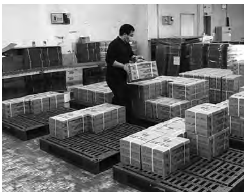
1 梱(3箱分)は10kgを超え、かなりの重さです。

出荷量は279t、1kgの単価は6月末での累計実績で586円(税抜き)となっており、昨年と比較して、晴天がなかなか続かないせいか、出荷量は少なくなっておりますが、単価は良好に推移しております。 次は大玉トマトですが、こちらの選果はすべて手作業となっております、生産者が収穫した大玉トマトをコンテナからサイズごとに分け、それぞれ箱詰めしていきます。各サイズで1箱に入る個数が決まっており、サイズを見誤ると入らなくなりますが、ベテランの方々は慣れた手付きでスムーズに選果を行っております。出荷状況はミニトマトと同様、少ないながらも単価は良好です。