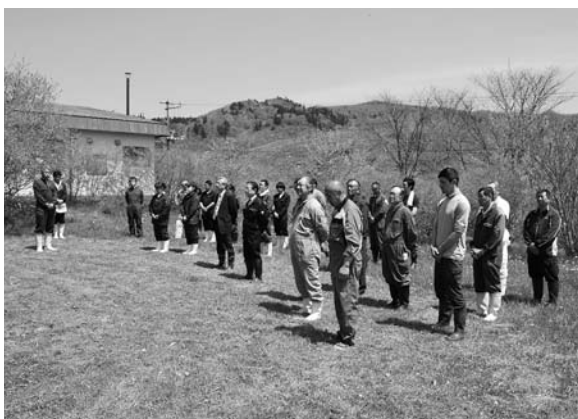
入牧後、牛魂祭が行われました