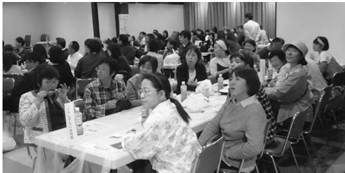
J A しずない女性部の皆さんも白熱！

今後は7月26日、9月27日、11月6日の3回の開催となります。ご家族、ご友人をお誘いの上会場までお越しいただき、ホッカイドウ競馬と一緒に盛り上げましょう！