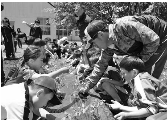
みんな真剣に取り組んでくれました!