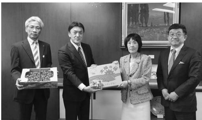
高橋はるみ知事に「太陽の瞳」を贈呈

5月21日、西村和夫組合長はしずくない産ミニトマト「太陽の瞳」の初出荷が開始したのをうけ、北海道議会の藤沢澄雄議員と新ひだか町の大野克之町長らと共に北海道庁を訪れ、高橋はるみ知事に初出荷を報告しました。昨年の販売実績が9億8500万円と過去最高の販売額で