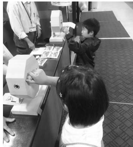
ガラボン当たったかな？