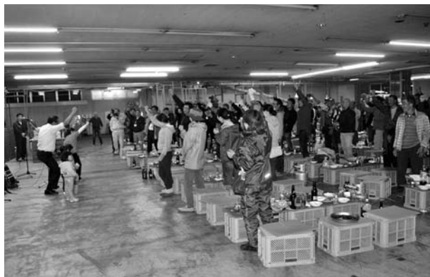
決意新たに一致団結！

また5月22日には野菜集出荷センターにて選果場開きを行い、ミニトマト生産者、農協、道内外の市場関係者ら140人が集まり、それぞれジンギスカンを囲み、今年のミニト