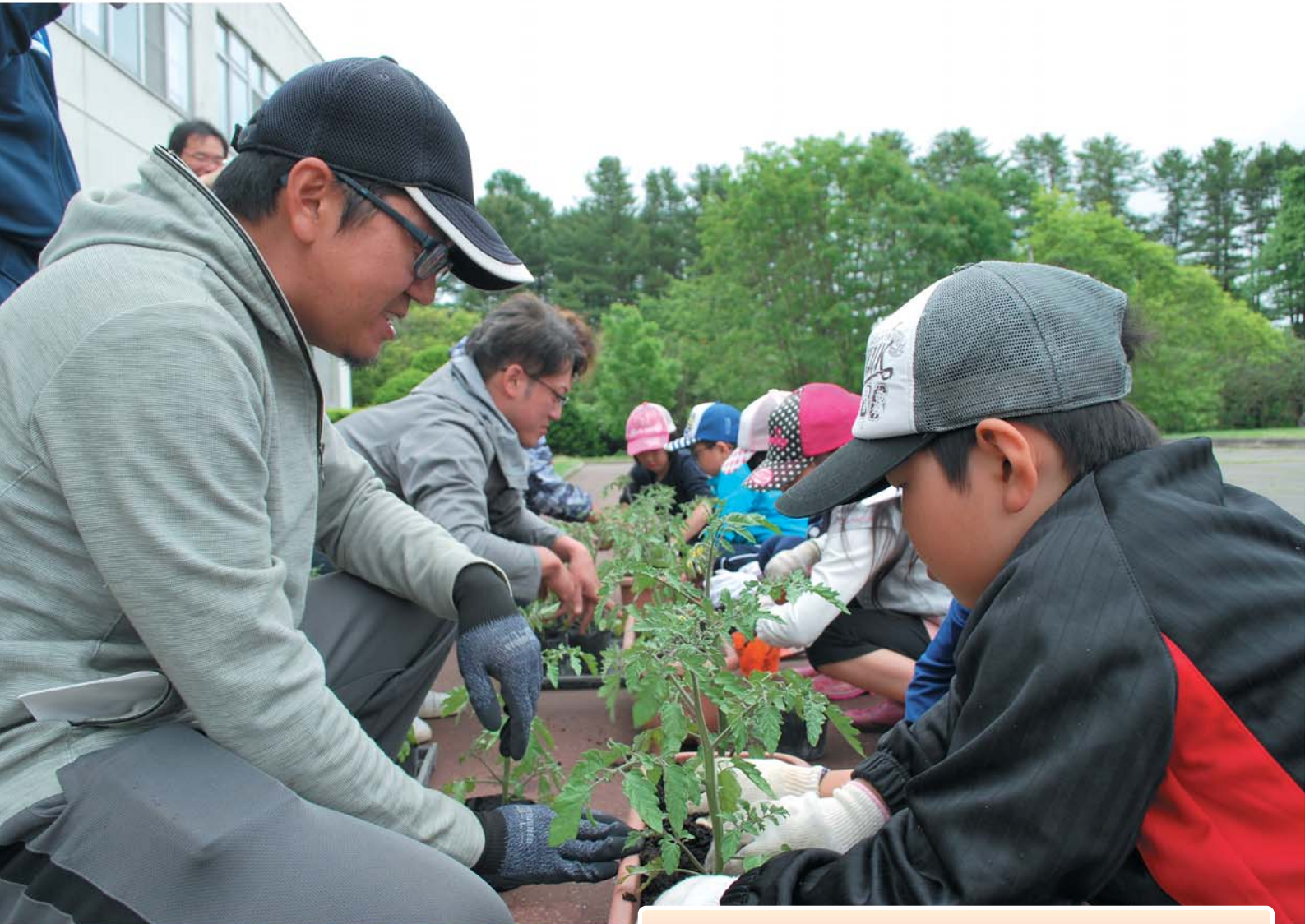
桜丘小学校での食育出前事業の風景