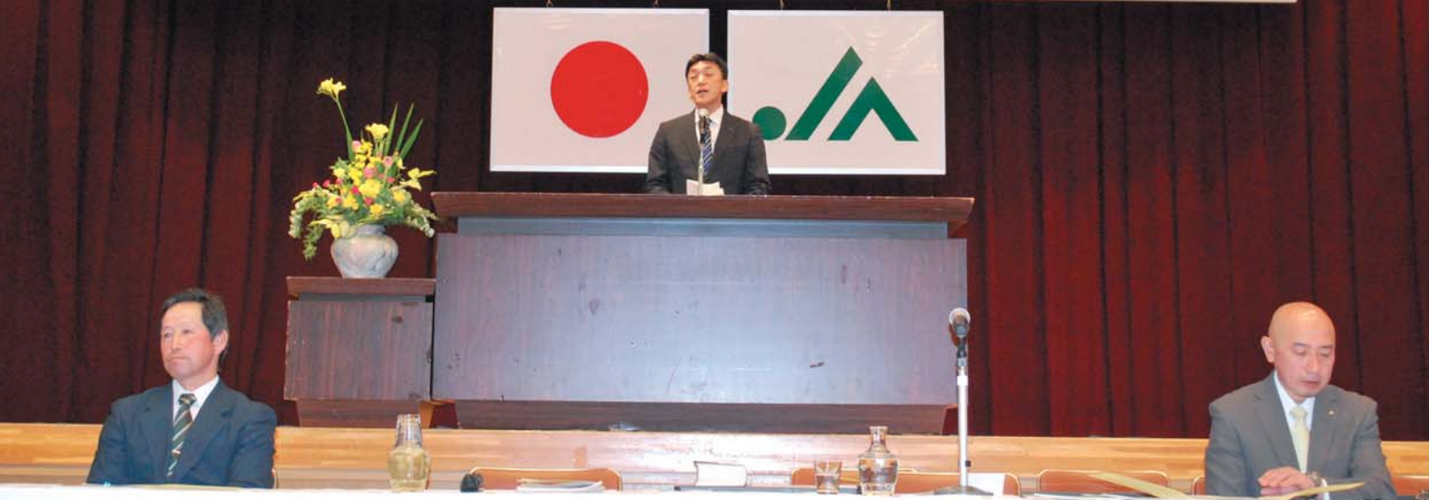
第69回 JAしずない通常総会