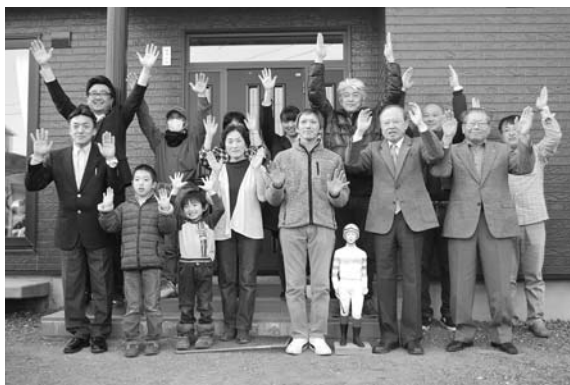
初のGI制覇おめでとうございます！

最後の直線に向けたセイウンコウセイは、内ラチ沿いの1番人気レッドファルクスと2番人気レッツゴードンキの競り合いを横目に馬場の真ん中を力強く駆け抜け、見事を優勝を飾りました。