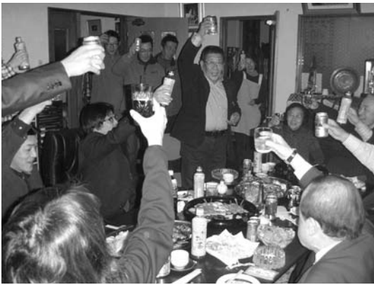
今度は皆さんで乾杯！