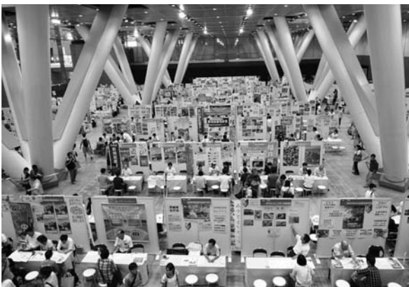
工夫された数多くのブースが出展しています！