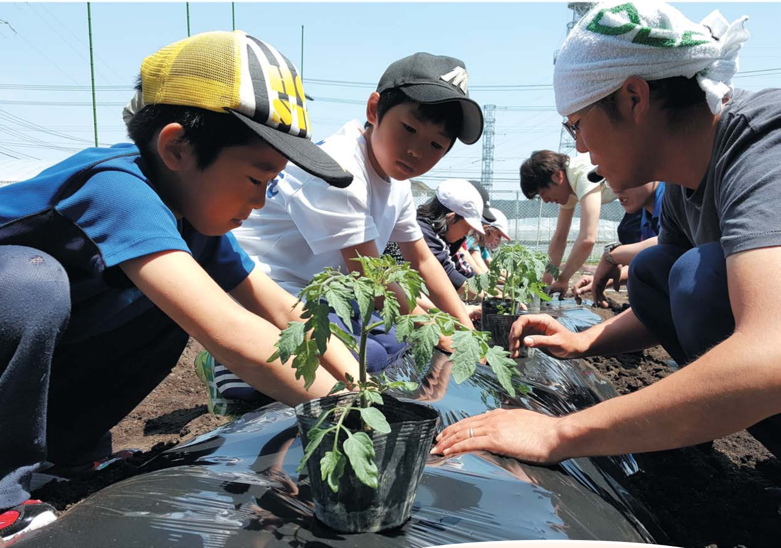
高静小学校での食育出前授業の風景