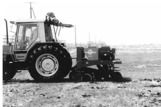
グレートブレインを使用している作業風景

ご不明な点につきましては、経済部資材課(TEL 46-2311)までお問い合わせ下さい。