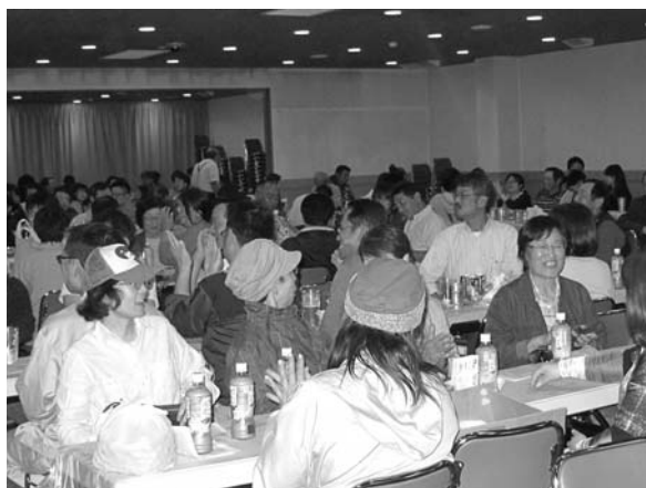
JAしずない女性部の方たちも大盛り上がりでした！

ホッカイドウ競馬は、馬産地である日高にとって、非常に重要な産業となっております。その産業を地元から盛り上げるべく、地域一丸となって支えたいきましょう。