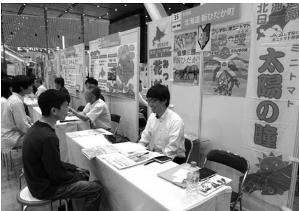
相談者に対する説明風景

JAしずないでも新規就農を目指す研修生の受け入れを平成24年度から実施しておりますが、これまでに5組の方が新たな農家としてスタートをきっており、6組の方が新規就農を目指し、研修を行っております。