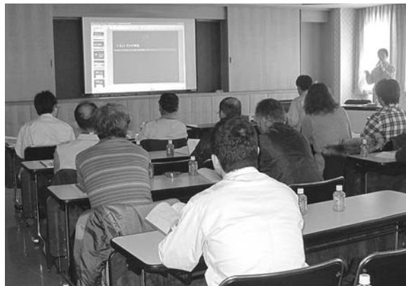
聞くだけでなく、視覚でも知識を吸収します。