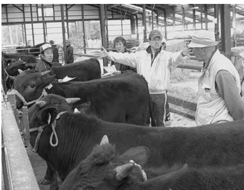
出陳間際の素牛をそれぞれ品評しています。