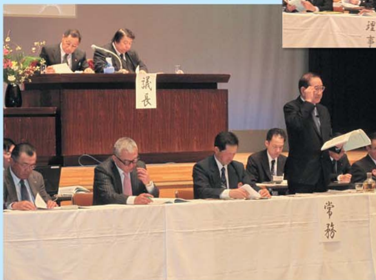
第64回 しずない農業協同組合通常総会開催