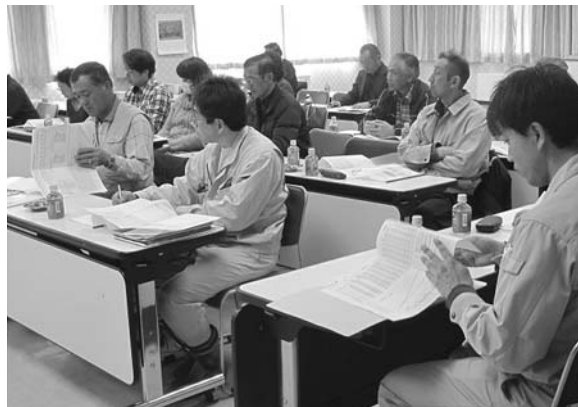
昨年以上の成績を目指し、熱心に耳を傾けています。

昨年、同部会では過去最高となる7億2000万円の販売金額を達成しており、今年も昨年以上の販売金額を目指し、そして、「太陽の瞳」の更なる品質向上へ向けて、参加した生産者たちも熱心に講習に耳を傾けていました。