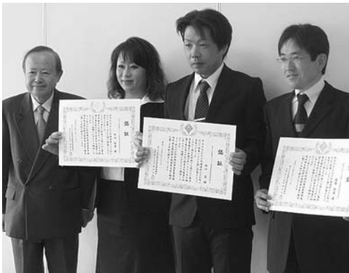
認証を授与され、皆さん意欲に燃えています！